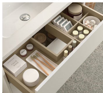
Organizer obere Schublade im Möbel eingeschlossen.